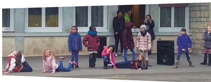
Danse le midi à Jean Moulin élémentaire

Bouger en cadence, réaliser des chorégraphies, être synchronisé avec ses camarades ou simplement s'amuser... Dans les écoles Jean Moulin et Jean-Louis Etienne, le midi, on exerce ses talents de danseur !